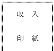
※印紙税額は裏面参照