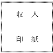
※印紙税額は裏面参照